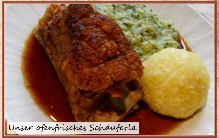
Unser ofenfrisches Schäuferla

* = auch als kleine Portion erhältlich Informationen zu Allergenen und Zusatzstoffen erhalten Sie an der Küche. Wir haben auch gluten- und laktosefreie Gerichte.