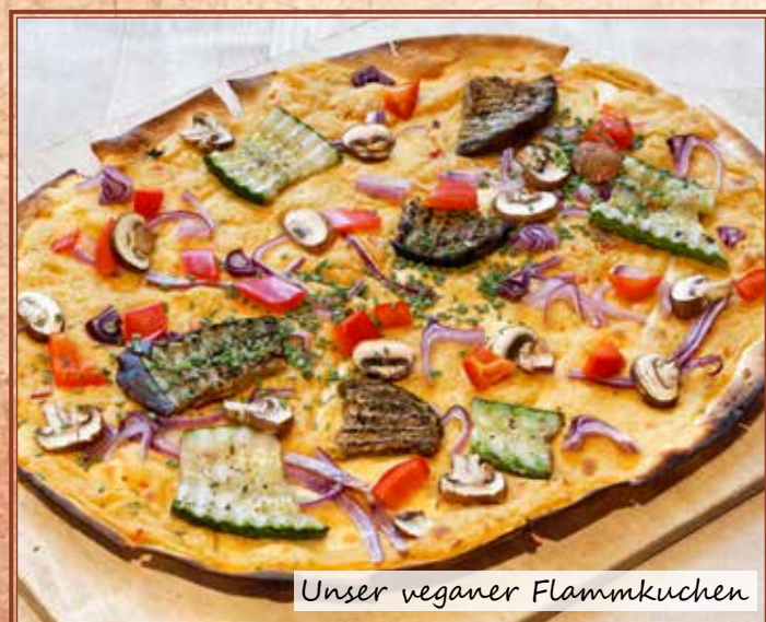
Unser vegane Flammkuchen

Gemischte Käseplatte 8,50 € Emmentaler, Gouda, Ziebeleeskäse, Gerupfter + Butter